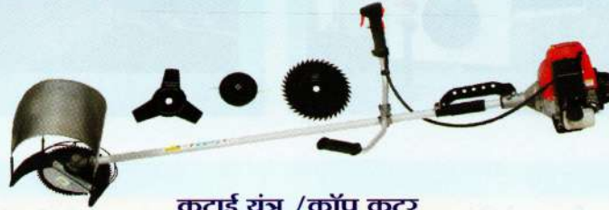
कटाई यंत्र / क्रॉप कटर Brush Cutter / Crop Cutter