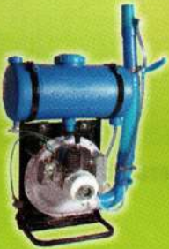
गणेश पॉवर स्प्रेयर Ganesh Power Sprayer