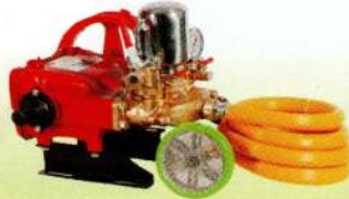
एचटीपी स्प्रेयर HTP Sprayer