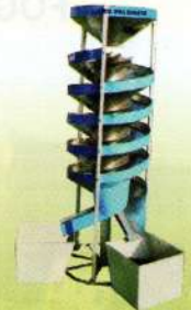
स्पायरल सेप्रेटर Spiral Separator