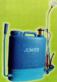
जम्बो डिलक्स नेपसेक स्प्रेयर Jumbo Deluxe Knapsack Sprayer