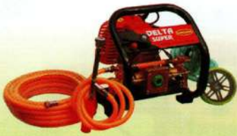
सुपर पोर्टेबल स्प्रेयर Super Portable Sprayer