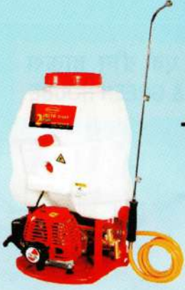
शक्ति पॉवर स्प्रेयर 2 Stroke Power Sprayer