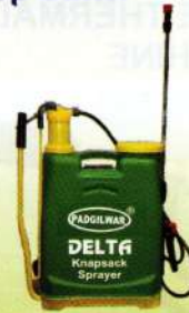
नेपसेक स्प्रेयर Knapsack Sprayer