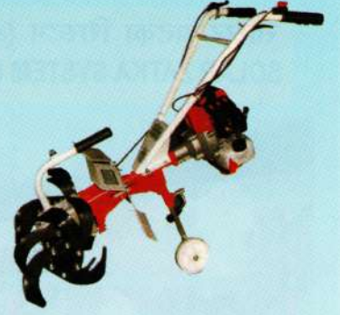
मिनी ट्रीलर Mini Tiller