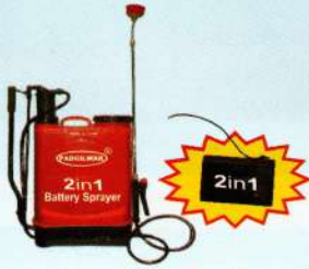
बैट्री कम हेण्ड स्प्रेयर 2 in 1 Battery cum Hand Sprayer