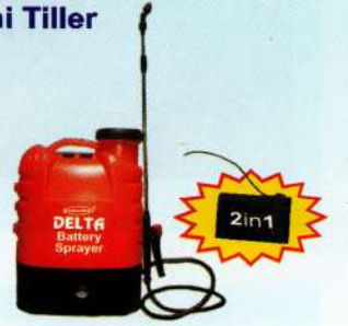
बैट्री स्प्रेयर Battery Sprayer