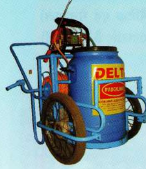
ट्रॉली स्प्रेयर Trolley Sprayer