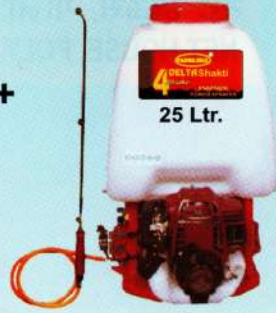
शक्ति पॉवर स्प्रेयर 4 Stroke Power Sprayer