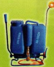
जयहिन्द डिलक्स हाइटेक स्प्रेयर Jai Hind Deluxe Hi-tech Sprayer